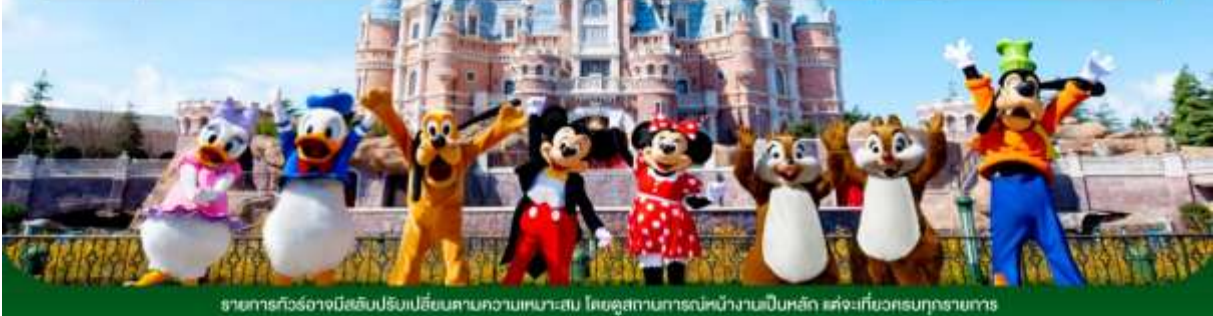
รายการทัวร์อาจมีฉบับปรับปรุงเปลี่ยนแปลงตามความเหมาะสม โดยดูสถานการณ์หน้างานเป็นหลัก แต่จะเกี่ยวข้องครบทุกรายการ