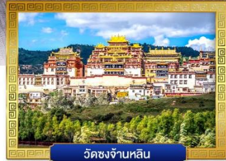
วัดชงจ้านหลิน