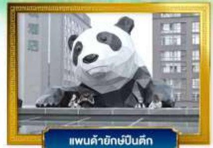
แพนด้ายักษ์ปิ่นตึก