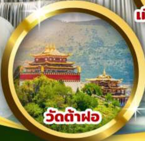
วัดต้าฝอ