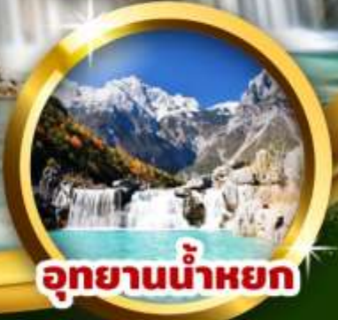
อุทยานน้ำหยก