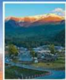
หมู่บ้านไปฮาปา