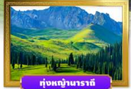
หุบภูเขานาราตี