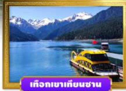
เทือกเขาเทียนชาน