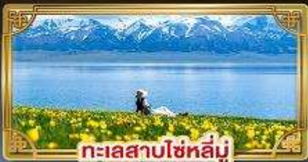
ทะเลสาบไซไห่หลู่