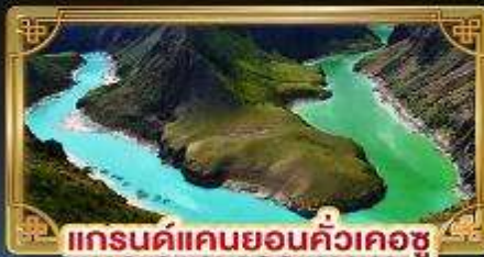
แกรนด์แคนยอนคั่วเคอซู