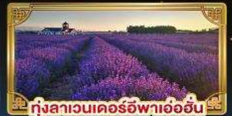
ทุ่งลาเวนเดอร์อิฟาเอ้อฮัน