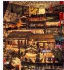
THE HILL CHANGCHUN