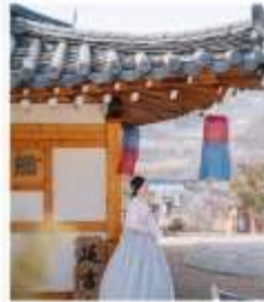
สวนวัฒนธรรม พื้นบ้านเกาหลี่