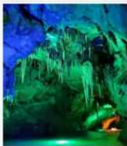
ถ้ำน้ำเป็นสี