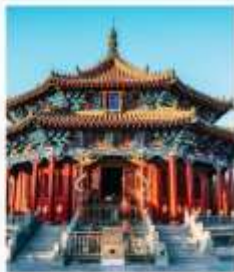
พระราชวังกุ๊กกง