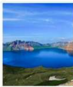
อุทยานดาวโปซาน