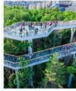
สวนต้นสน