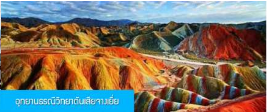
อุทยานธรณีวิทยาตันเสี่ยจางเยี่ย