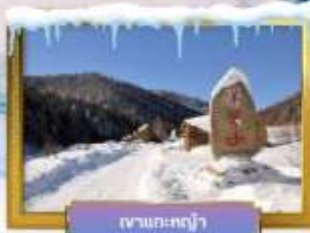
เขาน้ำแข็ง