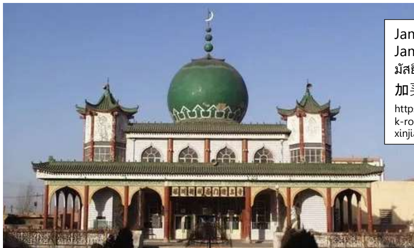
Jami Mosque Jama Mosque มัสยิดใหญ่จามา “ชิงเจินเฉียว” 加买清真寺 https://www.silkroadtravel.com/silk-road-group-tours/xian-gansu-xinjiang.html

นำท่านผ่านชม Jama Mosque 加买清真寺 มัสยิดใหญ่จามา “ชิงเจินเฉียว” เป็นมัสยิดหลักในโหตัน หรือ เหอเถียน ซินเจียง ประเทศจีน สร้างขึ้นในปี พ.ศ. 2413 และผู้อุปถัมภ์คือ Habibullah Khan มัสยิดตั้งอยู่ใจกลางเมืองเหอเถียน สัมผัสวิถีชีวิตของชาว Hotan ที่ Hotan Grand Bazaar ตั้งอยู่ทางตะวันออกเฉียงเหนือของเมือง Hotan มีสินค้าโภคภัณฑ์ และมีตลาดสำหรับวัสดุทางการแพทย์ของชาวอุยกูร์ แดง และผลไม้ ปัจจุบันการผลิตทางการเกษตร ปศุสัตว์ สินค้ามือสอง ฯลฯ