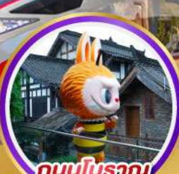
ถนนโบราณ ชอยกวางชอยแคบ