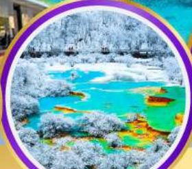
อุทยานหลวงหลง