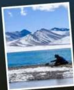
ทะเลสาบน่านมู่ซั่ว