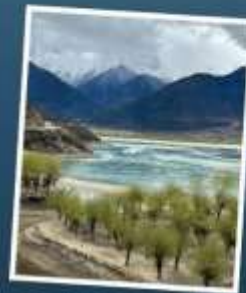
อุทยานเขาเป็นยี่