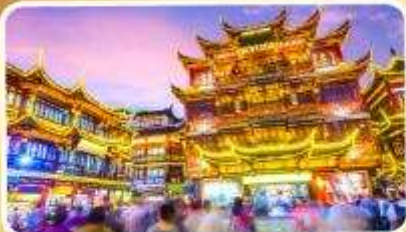
ตลาดร้อยปีเจิ้งหวงเหมียว