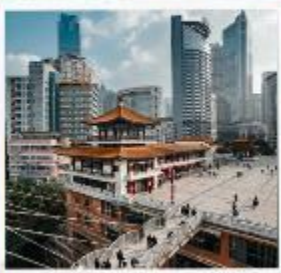
ตึกหุยซิง (ตึก 22 ชั้น)