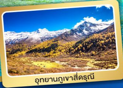
อุทยานภูเขาสีดรุณี