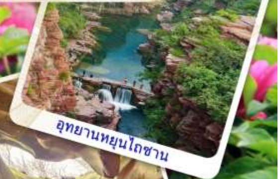
อุทยานหยุนโถซาน