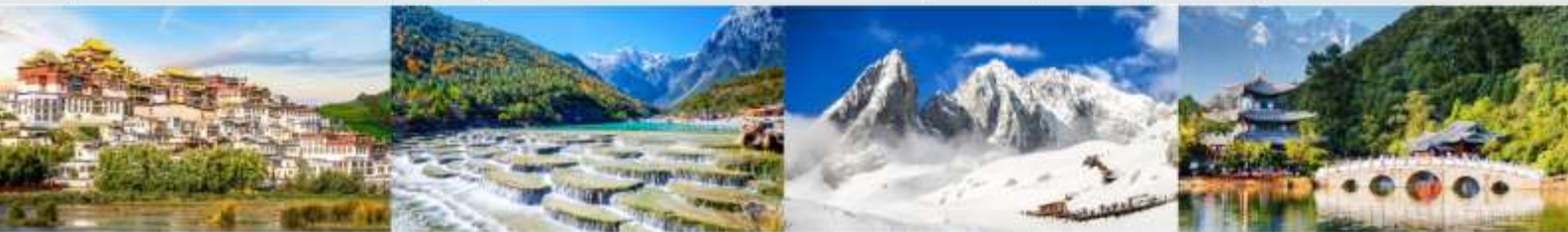
วัดลามะชงจ้านหลิน