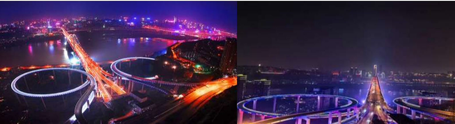
มหานครฉงชิ่ง

เช้า ๑๐บริการอาหารเช้า ณ ห้องอาหารของที่พักร หลังอาหารเช้าท่านเดินทางสู่ อุทยานเขานางฟ้า อยู่ทางตอนเหนือของแม่น้ำอู๋เจียงที่ระดับความสูงเฉลี่ย 1900 เมตร จากระดับน้ำทะเล และมียอดเขาสูงสุดที่ 2033 เมตร อุทยานเขานางฟ้ามีชื่อเสียงในเรื่องความสวยงาม ทางธรรมชาติที่แตกต่างกันไปในแต่ละฤดู จนได้รับการขนานนามว่าเป็นดินแดน 4 สิ่งมหัศจรรย์ คือมีป่าไม้หนาแน่น, ยอดเขาประหลาด, ทุ่งหญ้าเลี้ยงสัตว์และ ลานหิมะในสถานที่เดียวกันเพียงแต่ต่างฤดูกาลเท่านั้น และที่สำคัญที่สุดคือเป็นทุ่งหญ้าเลี้ยงสัตว์อันดับ 1 ทางภาคใต้ของประเทศไทย เที่ยง ๑๐บริการอาหารเที่ยง ณ ภัตตาคาร จากนั้นนำท่านสู่ ฉงชิ่ง จากนั้นนำท่านชม จุดชมวิวกกลมทองหยวนฉงชิ่ง เป็นจุดชมวิวกของมหานครฉงชิ่ง เขตปกครองพิเศษ ของจีน อิสระให้ท่านถ่ายภาพและดื่มด่ำความสวยงามของ