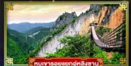
หุบเขารอยแยกอู่หลิงซาบ