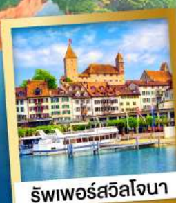
รัฟเฟอร์สวิลโจนา