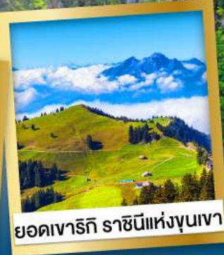
ยอดเขาธิกี ราชนีแห่งขุนเขา