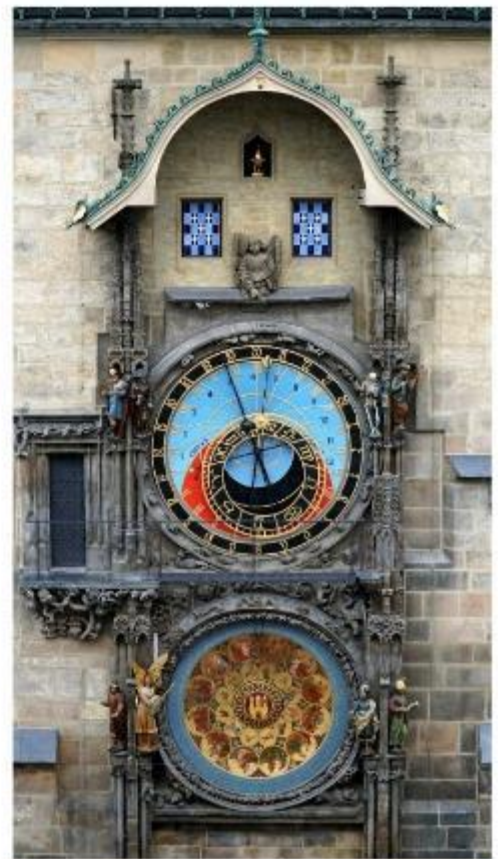
นาฬิกาใช้ทอล์คเค้นทรัม

นำท่านชม บ่อหมีสีน้ำตาล สัตว์ที่เป็นสัญลักษณ์ของกรุงเบิร์น นำท่านชม มาร์กาสเซ ย่านเมืองเก่า ปัจจุบันเต็มไปด้วยร้านดอกไม้และบูติก เป็นย่านที่ปลอดภัย จึงเหมาะกับการเดินเที่ยวชมอาคารเก่า อายุ 200-300 ปี นำท่านลัดเลาะชม ถนนจุงเคอร์นกาสเซ ถนนที่มีระดับสูงสุดของเมืองนี้ ซึ่งเต็มไปด้วยร้านภาพวาดและร้านขายของเก่าในอาคารโบราณ ชม นาฬิกาใช้ทอล์คเค้นทรัม อายุ 800 ปี ที่มีโชว์ให้ดูทุกๆชั่วโมงในการตีบอกเวลาแต่ละครั้ง หอนาฬิกาใน ช่วงปี ค.ศ. 1191-1256 ใช้เป็นประตูเมืองแห่งแรก ภายหลังได้ดัดแปลงใช้ทอล์คเค้นทรัมให้กลายมาเป็นหอนาฬิกาพร้อมติดตั้งนาฬิกาดาราศาสตร์เข้าไป