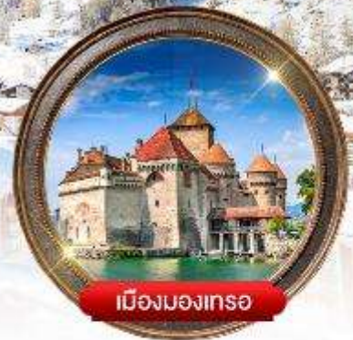
เมืองมงเทรซ