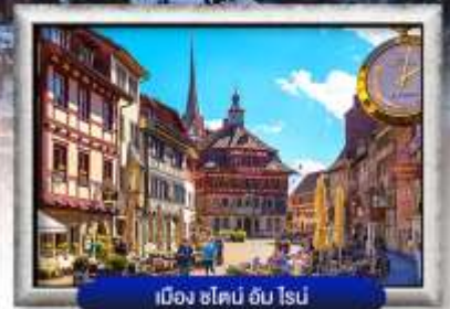
เมือง ซ็ไตน์ อัม ไรน์