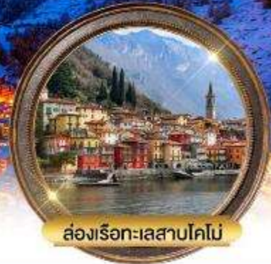
ล่องเรือทะเลสาบโคโม