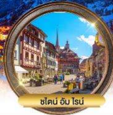
ชไตน์ อัม ไรน์