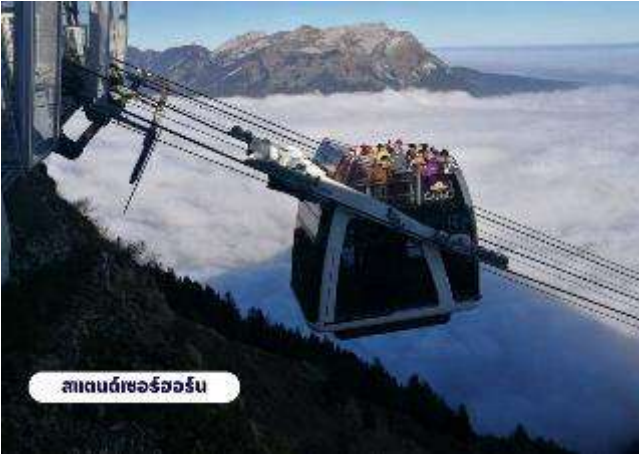
สแตนเซอร์ฮอร์น

☉ บริการอาหารเช้า ณ ห้องอาหารของโรงแรม จากนั้นนำท่านเดินทางสู่สถานีกระเช้า เพื่อเตรียมตัวเดินทางขึ้นสู่ ยอดเขาสแตนเซอร์ฮอร์น (Mt.Stanserhorn) มีความสูงที่ 1,898 เมตร(6,227 ฟุต) ระหว่างทางคุณจะได้ชมวิวแบบพาโนรามาและให้ท่านได้สัมผัส การเดินทางโดยขึ้นกระเช้า “Cabrio” กระเช้าลอยฟ้าเปิดประทุนที่มี 2 ชั้นแห่งแรกของ โลก และสามารถจุผู้โดยสารได้เกือบ 60 ท่าน โดยขึ้นดาดฟ้าจะสามารถดูได้ 30 ท่าน ระยะ เกือบ 2 กิโลเมตร ระหว่างทางขึ้นสู่ยอดเขาท่านจะสามารถมองเห็นวิวแบบ 360 องศา จากนั้นให้ท่านได้เพลิดเพลินกับความสวยงามของธรรมชาติและทัศนียภาพที่งดงาม