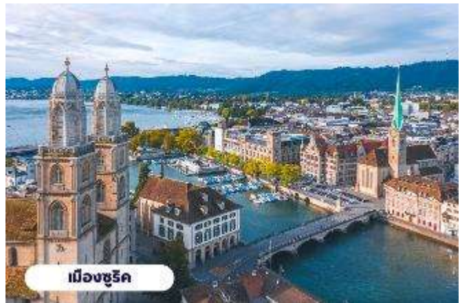
เมืองซูริค

การค้าสัตว์ที่สำคัญของเมืองซูริค ปัจจุบันจัตุรัสนี้ได้กลายเป็น ชุมทางรถรางที่สำคัญของเมือง และยังเป็นศูนย์กลางการค้า ของย่านธุรกิจ ธนาคาร สถาบัน การเงินที่ใหญ่ที่สุดในประเทศ สวิตเซอร์แลนด์ นำท่านแวะ ถ่ายรูปกับ โบสถ์ฟรอมุนสเตอร์ (Fraumunster Abbey) จากบนสะพานมุนสเตอร์