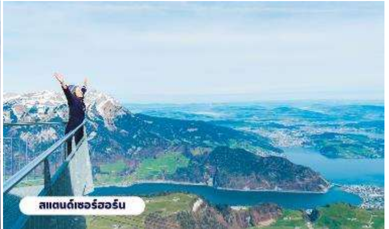
สแตนเซอร์ฮอร์น