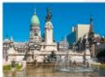
ชมเมืองบัวโนสไอเรส

23.55 น. ออกเดินทางสู่สนามบินอีสตันบูล เพื่อการบิน TK16