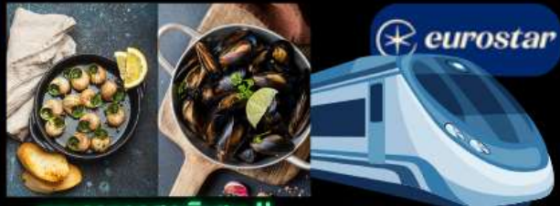
เมนูอาหารสุดพิเศษ !! หอยแมลงภู่อบไวน์ขาว และหอยเอสคาโก้ รถไฟความเร็วสูง จาก เบลเยียม สู่ ฝรั่งเศส