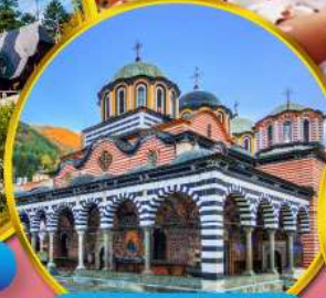
อารามมรดกโลกริลา

บุกดินแดนแห่งรัตติกาล ชมเทศกาลกุหลาบ 1 ปี มีเพียงครั้ง สัมผัสวิถีชีวิตชนพื้นเมือง เยือนเส้นทางมรดกโลก