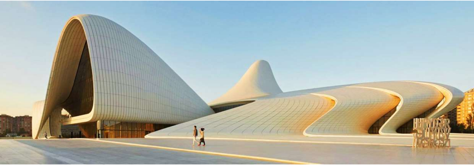
นำท่านแวะถ่ายรูป ศูนย์ศิลปะไฮดา อาลียอฟ (HEYDAR ALIYEV CENTER) สถาปัตยกรรมล้ำค่าของประเทศ อาเซอร์ไบจานที่มีรูปทรงทันสมัยแบบ MODERN-ABSTRACT