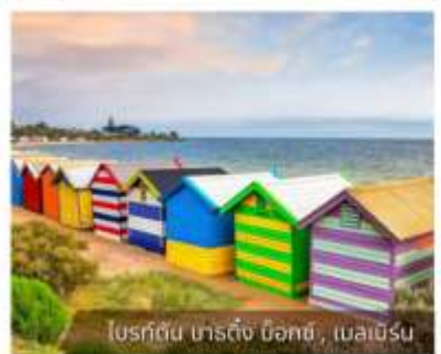
โบสถ์ต้น นาร์ดีง บิชอป, เมลเบิร์น