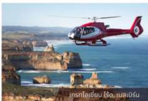
เฮลิคอปเตอร์ ไรต์, เมลเบิร์น