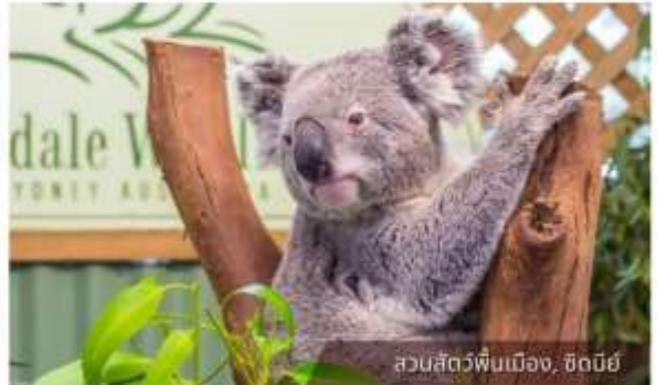
สวนสัตว์ฟินเมือง, ซิดนีย์