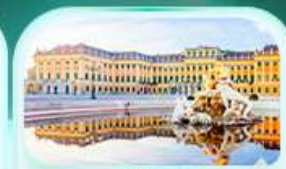
พระราชวังเชินบรุนน์