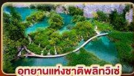
อุทยานแห่งชาติพลิกวิเช