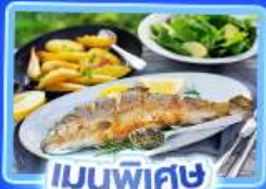
เมนูพิเศษ ปลาเกรดอย่าง

อัลสส์ตีทท์ เวียนนา อินส์บรุค ปราสาทนอยชวาสไตน์ ลูเซิร์น ริก