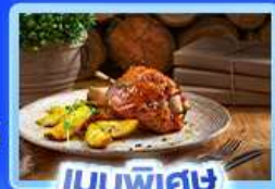
เมนูพิเศษ ขาหมูเยอรมัน